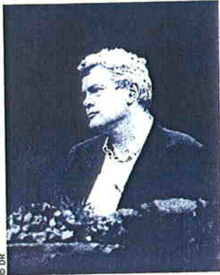
LAURENT FABIUS MINISTRE DES AFFAIRES ÉTRANGÈRES ET COOPÉRATION INTERNATIONALE ET DÉVELOPPEMENT DURABLE

Terribles paradoxes. Alors que l'obésité progresse dans les pays développés, 840 millions de personnes connaissent une sous-alimentation chronique, essentiellement dans les pays en développement. Un tiers des habitants de notre planète est frappé par la malnutrition, alors que l'agriculture mobilise 45 % de la population active mondiale. Malgré de fantastiques progrès scientifiques et agronomiques, dont certains font débat, comme les OGM, « nourrir les hommes, nourrir le monde » demeure un défi de civilisation. Le relever exige de produire plus et mieux, grâce à une gestion durable des ressources et de l'environnement, dans un cadre plus solidaire.